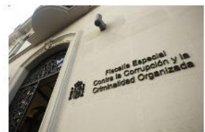
3.2. Fiscalia Anticorrupció de l'Estat