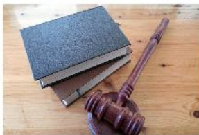
2. Legislació: transparència i lluita contra la corrupció

Sección de la página web del Observatori, en la que recopilamos información sobre directivas, leyes y organismos centrales por su importancia en la lucha contra la corrupción. Este año 2020, hemos incluido seis nuevas notas.