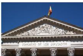
2.3. Proposició Llei Integral lluita contra la corrupció. Congrés