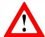
2.2. Llei de la GVA d'inspecció i sistema d'alertes