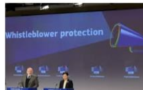
2.1. Directiva Europea de Protecció de Denunciants (actualització)