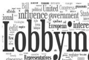
2.4. Llei reguladora activitat lobbies. Comunitat Valenciana