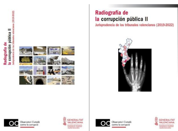
Portada del Quadern

Quadern Pedagògic N°4 "Radiografia de la corrupció pública a la Comunitat Valenciana II. Jurisprudència dels Tribunals Valencians 2019-2022"