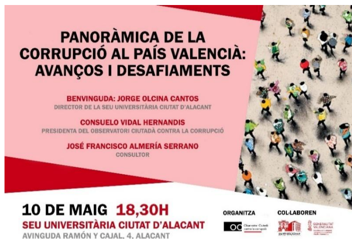
Cartell de l'acte